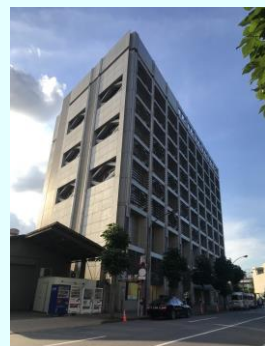
スタジアムプレイス青山