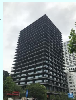
赤坂センタービルディング