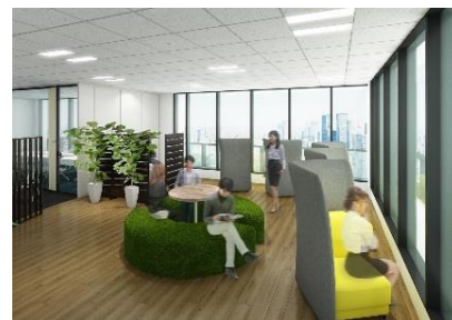
リラックスラウンジ「リフレ」