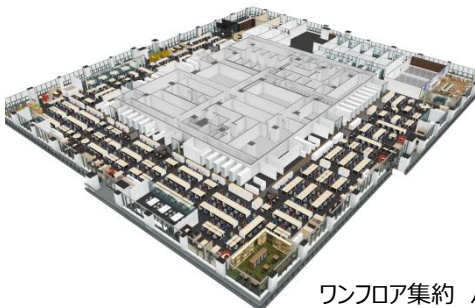
ワンフロア集約 パースイメージ

また、執務室内の窓側にはフリースペースを設け、目的に応じたワークスタイルをサポートします。