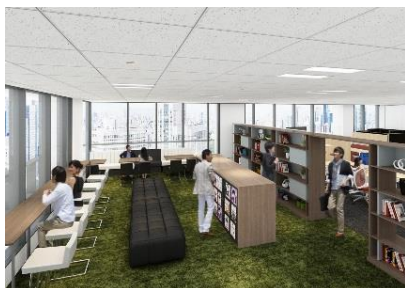
ライブラリーラウンジ「ライブラリー」