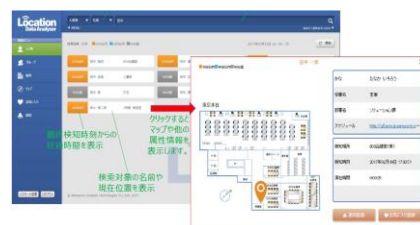
オフィス環境運用システム (イメージ)

フリーアドレス導入にあわせ、リアルタイムで社員の居場所が把握できるパナソニックソリューションテクノロジー社のシステムを導入しました。移転前の段階で社員の位置情報をデータ化し、会議室やフロアでの稼働率を集積。新オフィスのレイアウトの最適化や会議室の適正数の算出に活用しました。