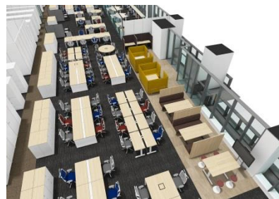
オフィス内 イメージ