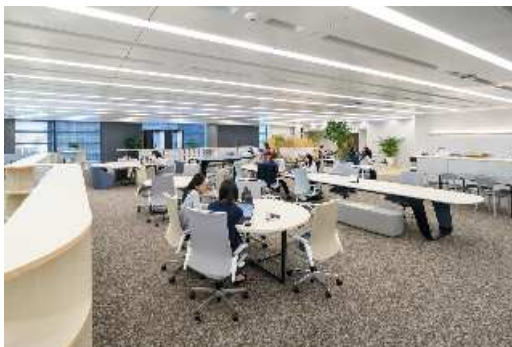
営業部署スペースはフリーアドレスを採用

今後も当社は、多様化かつ高度化するオフィスニーズに対し、クライアントのニーズに沿ったサービスの充実に努めてまいります。