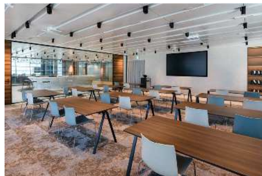
会議室は目的にあわせて様々なレイアウトが可能